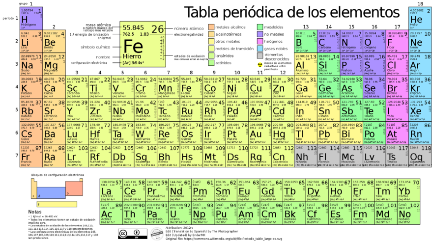
Figura 3. Tabla periódica de los elementos. Representa las diferentes sustancias que componen el universo conocido.