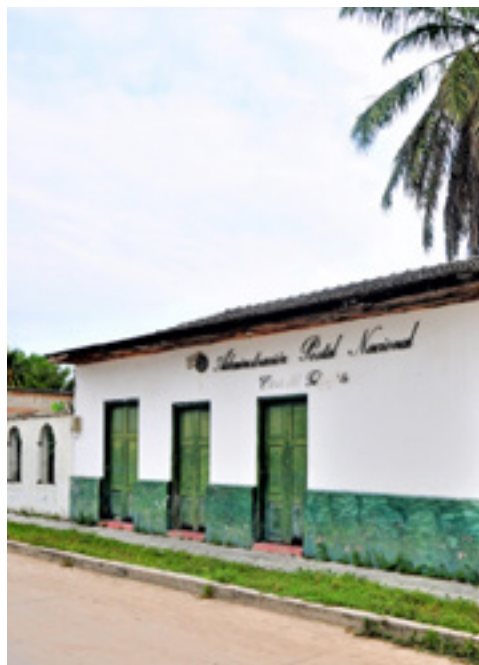
Antigua Casa del Telégrafo en Aracataca.

marcados por una serie de fracasos debido a la poca venta de sus primeros libros de literatura (Arias, s.f).