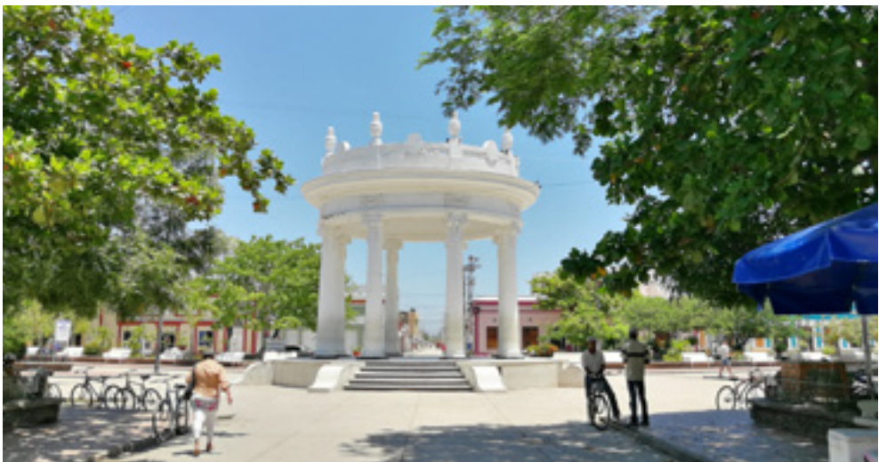
El Templete en el Parque Centenario de Ciénaga inspirada en los templos Romanos.

A pesar de que no cuenta con una infraestructura hotelera adecuada para desarrollar un turismo competitivo de calidad, el Centro Histórico de Ciénaga fue declarado dentro de los Pueblos Patrimonio de Colombia, pues se destaca por características como: