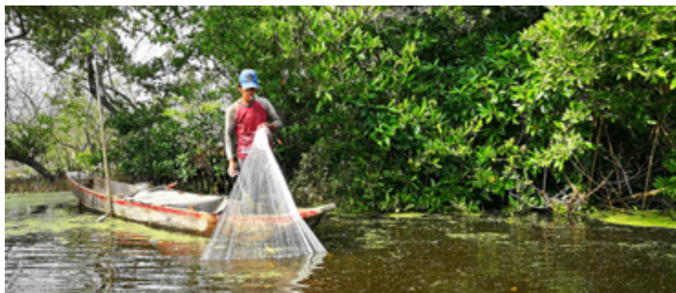
Pescador en la Ciénaga Grande.

Es importante mencionar que antes de que existiera la carretera que comunica a Santa Marta con Barranquilla, el medio de transporte utilizado más común para movilizarse y transportar carga era el ferry o las embarcaciones que navegaban por el río Magdalena, por