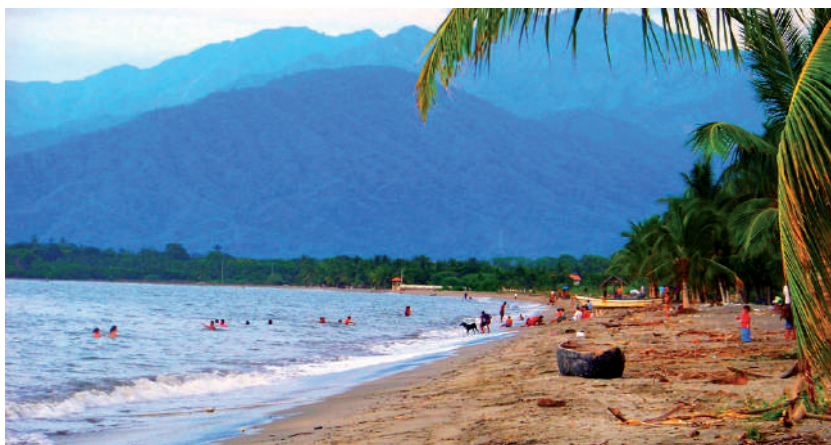
Foto: Playa Ciénaga. Foto tomada por Esperanza Ardila, septiembre de 2009.

que hay en esa zona es arborización de frutales, coco y mango que es lo que predomina. en el sector de La Playita son nueve parcelas, eh, hay algunos que no viven los propietarios sino que tienen familias que le cuidan eso ahí, hay aproximadamente, habitantes, viviendo permanentemente ahí unas 40 a 50 personas... y se concentra más para vacaciones porque el único colegio que quedaba en el sector también quedó en medio del puerto de Sociedad Portuaria del Río Córdoba, fue anulado la población de Mahoma que era otra población desplazada del sector de donde construyeron Sociedad Portuaria, entonces se redujo la población educativa, quedaron pocos niños y los profesores no quisieron ir más a esa zona por el transporte, por los caminos malos en invierno, entonces la mayor parte de nuestros niños o todos nuestros niños estudian en el casco urbano del municipio de Ciénaga, entonces se van los fines de semana y las vacaciones. La distancia no es muy grande entre Ciénaga y La Playita, eso más o menos del último barrio que es el barrio Costa Verde a Playita está, dista aproximadamente dos kilómetros (Ausberto Márquez, 17 de julio de 2009. Ciénaga).