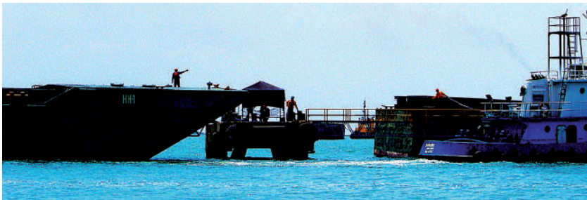
Foto: Puerto y barcaza. Foto tomada por Laura Chaves, octubre de 2009.

Accidentes han habido en las barcazas, han habido en las grúas pero accidentes mínimos de personas que se han doblado un pie, de personas que se han resbalado. Pero eso así, es muy tajante el puerto con eso de la seguridad industrial, que la gente porte el elemento de seguridad industrial, porte su casco. Lo que te decía anteriormente de la mascarilla, esto, o sea lo de la mascarilla es algo que se usa únicamente en ciertas partes del puerto: en donde está la banda transportadora se utiliza. Pero hay partes que no es reglamentado el uso de la mascarilla, que debería ser por todo el puerto, porque en todo el puerto hay carbón volando en el aire. Pero nada más es en el área donde está la banda transportadora. Pero hay partes que muchas