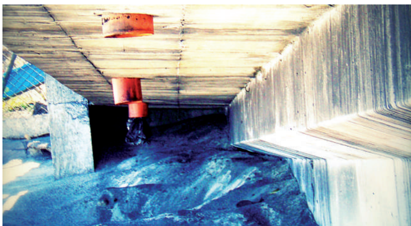
Foto: Restos de carbón debajo de un muelle. Foto Tomada por Laura Chaves, septiembre de 2009.