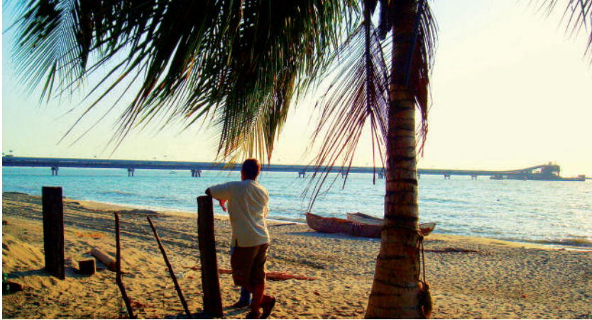
Foto: Mirando el muelle. Foto tomada por Cristian Ternera, sector Ojo de Agua, Ciénaga, junio de 2009.

Tenemos una parcela allí ubicada a la orilla del mar donde se cultiva el coco, el mango, son cosechas como el mango, que son cosechas en el año que se complementan con la pesca, cuando no estamos en la pesca, pues estamos en esa actividad, eh, también me he caracterizado en esta zona de ser un líder preocupado por la situación que viven, que han vivido los pescadores en este sector, sobre todo en estos últimos quince años cuando el Gobierno Nacional a través de un documento Conpes en el año 90 declara la zona comprendida entre el río Córdoba y la quebrada El Doctor como zona de expansión portuaria carbonífera, entonces me preocupó porque lógicamente nos iba a ocasionar un impacto, eh, varias... un impacto positivo y lógicamente un impacto negativo, pues fue así como se instaló en el año 94 el puerto Drummond, ubicado en el sector Ojo de Agua, límite con Santa Marta, correspondiente acá con el municipio de Ciénaga, pues nosotros al vernos amenazados entre comillas por la ocupación de esta zona porque sabíamos que el Estado necesita desarrollarse y hay que darle paso al desarrollo, pero que también lleguemos a ser limitados en nuestras labores de pesca, ya que allí en la ensenada de Los Alcatraces, por ser una ensenada, la proximidad de los ríos