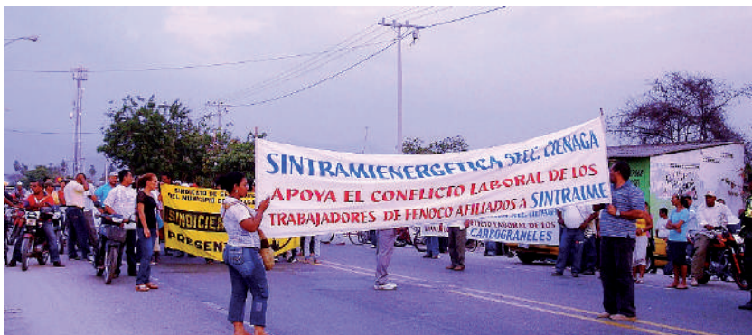
Foto: Manifestación del Frente Común. Ciénaga, abril de 2009.