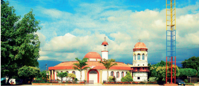
Foto: Iglesia de La Jagua de Ibirico.