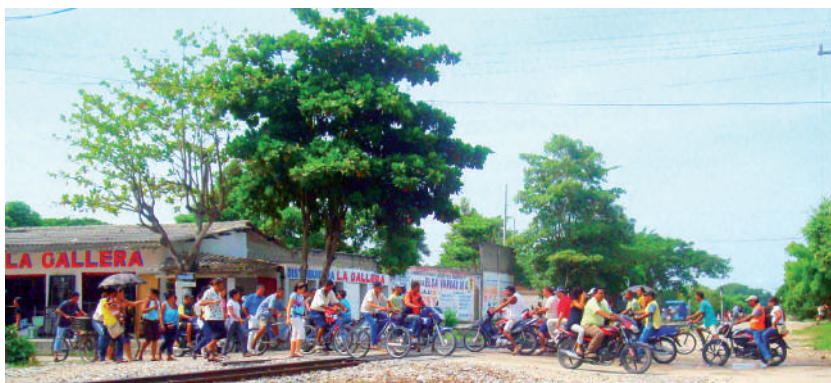
Foto: Después de pasar el tren. Foto tomada por Jorge Giraldo, septiembre de 2009.