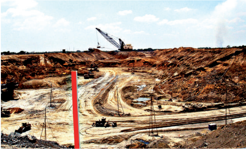
Foto: Panorámica de una mina. Julio de 2009. Departamento del Cesar.