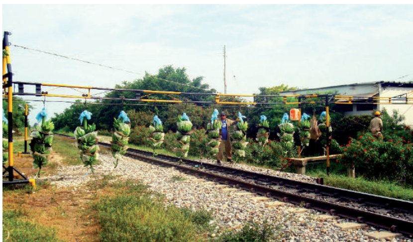
Foto: Entre la línea y el banano. sector rural de Río Frío, Zona Bananera, Agosto de 2009.