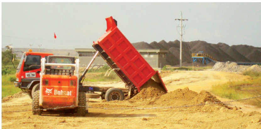
Foto: En la vía del carbón, ruta que comunica la Jagua de Ibirico con el corregimiento de La Loma, 2009.