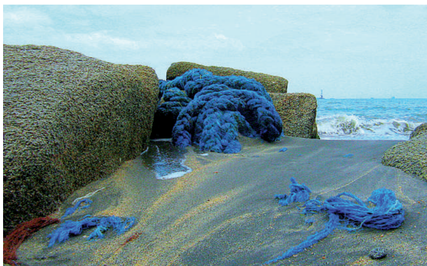
Foto: Objeto en la playa. Don Jaca, junio de 2009.

pesca se ha alejado, o de pronto no se ha alejado, hoy está concentrada en las zonas vedadas, hay un trasegar de grandes embarcaciones, de una cantidad de elementos que se requieren para el desarrollo, para el transporte del carbón, hay barcazas, grúas, remolcadores, lanchas, las bandas transportadoras, todo eso, el Estado les concede unas áreas que son limitadas a través de boyas, no podemos acceder a esas zonas, eh, la pesca generalmente se concentra donde no lo ataca el pescador y donde hay sombra y los elementos allí establecidos, pues causan sombra, encontramos abundantes peces cuando nos atrevemos a entrar a esa zona, hemos encontrado abundante pesca en las boyas, debajo de las barcazas, sobre todo cuando las barcazas demoran unas semanas o meses allí amarradas a las boyas, entonces esto quiere decir que de pronto la pesca no se ha alejado, sino que está limitada por la misma circunstancia del transporte del carbón (Ausberto Márquez, 17 de julio de 2009, Ciénaga).