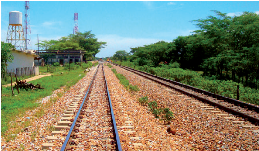
Foto: Vereda La Estación, municipio El Paso.