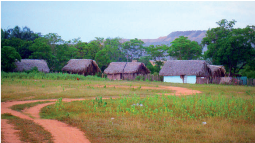
Foto: El Hatillo. corregimiento de La Loma, 2009.