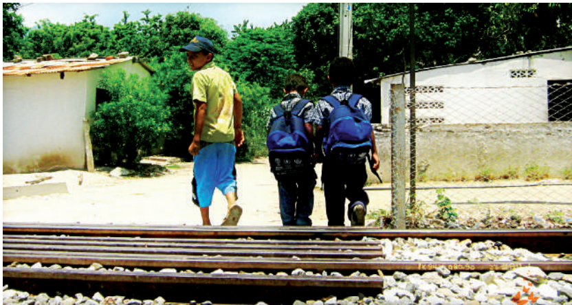
Foto: Niños cruzando la línea.