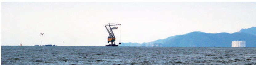
Foto: Grúa frente al camellón de Ciénaga. Foto tomada por Esperanza Ardila, noviembre de 2009.