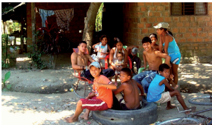
Foto: Combo de niños, niñas y adolescentes de Aracataca. Foto tomada por Jorge Giraldo, octubre de 2009.

cerdos, pavos, chivos, etc.; destruye mi casa porque cuando pasa con una velocidad máxima, daña las paredes de mi casa y yo soy una víctima de él porque no me deja dormir, me trasnocho y a veces no puedo ir al colegio. Yo soy víctima porque vivo al frente de él y convivo con él [tren del carbón]. Cosa productiva porque a mi madre y a muchas mujeres les brindó la oportunidad de “destejería” y ellas aprendieron mucho de eso [cursos de manualidades que ofrece la empresa FENOCO a las comunidades que colindan con la línea férrea], se les agradece por un lado, pero por el otro no (niña de 12 años del corregimiento de Río Frío, 10 de noviembre de 2010).