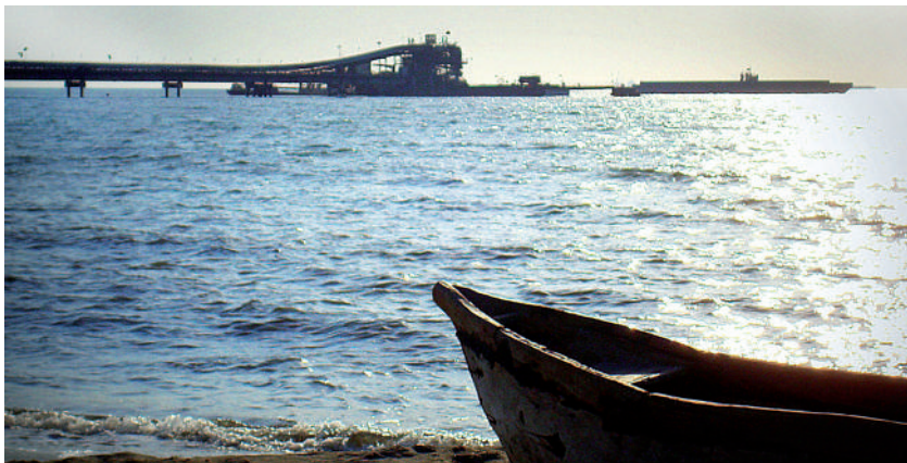
Foto: Pesca y puerto. sector Ojo de Agua, Ciénaga, junio de 2009