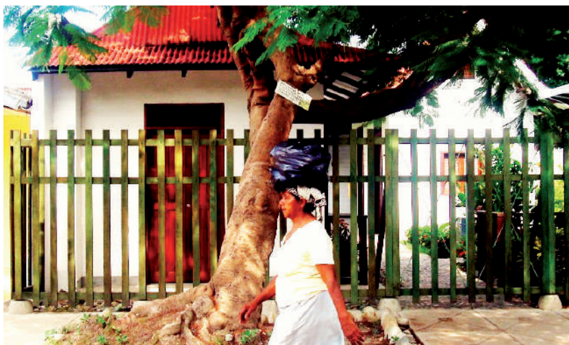
Foto: Pasando por la casa de Gabo, Aracataca.