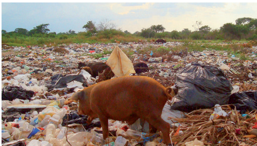
Foto: Botadero de basura, corregimiento de La Loma, 2009.