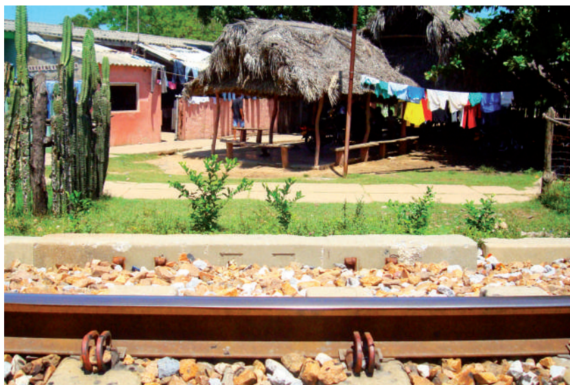
Foto: La cercanía del tren. vereda La Estación, municipio El Paso, 2009.

Son situaciones que uno ve, esta mañana yo hablaba con una muchacha de Prodeco, de por qué ponen personas, por lo menos en recursos humanos, que no tienen a nivel de, nivel de comunidad, no tienen ninguna relación. Yo creo que una persona de recursos humanos de estas empresas lo primero que debería tener es sensibilidad social, la situación más grave la tienen las personas de aquí [...] Yo no sé qué porcentaje tenga la inversión en una mina de esas pero te garantizo que el departamento de inversión social en los municipios debe ser el departamento que tiene el presupuesto más pequeño de las minas, eso sí te lo garantizo [...] con la problemática que tenemos y con la plata que maneja una mina, uno no está diciendo que se gane, o se gane diez mil millones de dólares, o diez millones de dólares, 20 millones de dólares o cincuenta millones de dólares, que invierta todo en la comunidad, pero que invierta al año unos, ojalá y una empresa invierta 1.000 millones de pesos en cada comunidad pa' que veas tú, si quiera mil, pa' que veas como se viera el cambio. Tú sabes que todos no podemos trabajar en la mina, todos no queremos trabajar en la mina, tenemos una población, aquí alrededor tenemos tierras productivas, te digo, que ningún casino de eso, compra ni siquiera una libra de yuca aquí, como te incentivas tú a comprar yuca si no te