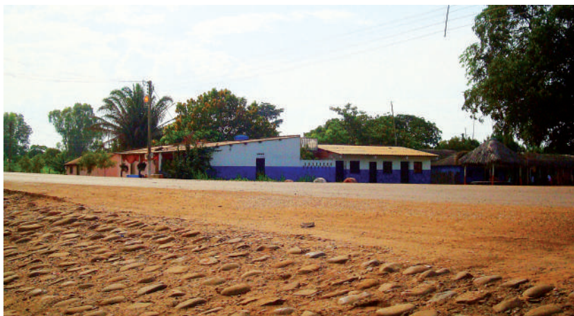
Foto: Vereda Plan Bonito, corregimiento de La Loma. Foto tomada por Cristian Ternera, 2009.