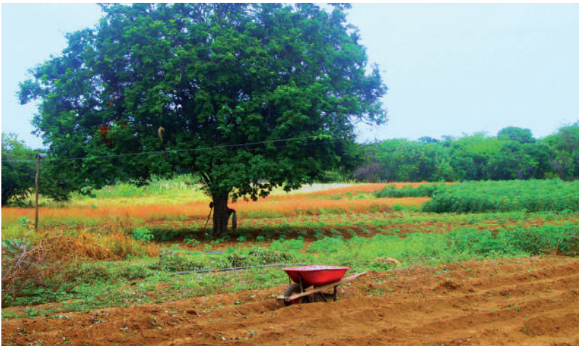
Foto: Cultivo en Don Jaca parte alta.