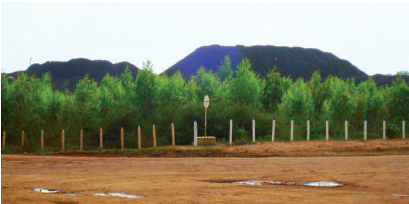
Foto: Montañas de estériles. ruta que comunica la Jagua de Ibirico con el corregimiento de La Loma, 2009.

Otro impacto digamos del punto de vista político es que empieza a generarse las regalías mineras por parte del carbón. Las regalías hacen que los presupuestos de estos municipios que antes eran pobres se aumenten 300, 400, 1.000 mil por ciento y mucho más con relación al presupuesto que tenían anteriormente en el caso de la Jagua de Ibirico, por ejemplo. Pero entonces se presenta una situación de