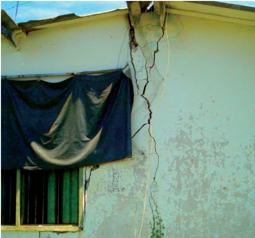
Foto: Lo que deja el carbón. Foto tomada por Cristian Ternera, vereda La Estación, municipio El Paso, 2009.

Hace 25 años aquí no había problemas sociales, no teníamos mendicidad en las calles, la prostitución no voy a decir que no existía porque la prostitución ha existido toda la vida, si nos remontamos a la Historia Sagrada, pues encontramos que María Magdalena era, dicen que es el arte, el oficio más viejo del mundo, pero lo que sucede hoy en La Jagua es una cosa aterradora, hoy uno camina por los barrios y por el centro y lo que encuentra son niñas, te comento un ejercicio. Yo le doy clase a un curso de cuarto, y en una actividad que teníamos que hacer, una mesa redonda y buscar un tema para esa mesa redonda, entonces se me ocurrió decirle a los pelaos que hicieran una encuesta en el barrio de cuántas niñas embarazadas menores de edad se podían encontrar, y los pelaos salieron y en media hora encontraron doce, o sea en dos cuadras doce niñas embarazadas, ¡en dos cuadras!, en una población de unos 300 habitantes, entonces si