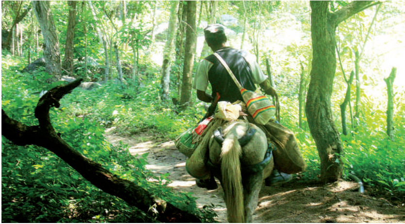
Foto: Por caminos de Don Jaca arriba.