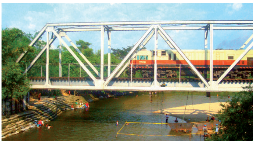
Foto: El tren pasando por el puente del río Aracataca.