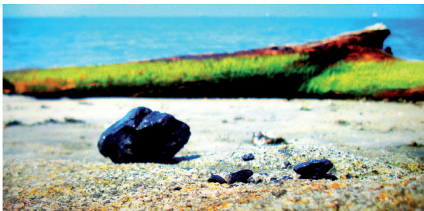
Foto: Carbón y playa. Foto tomada por Laura Chaves, septiembre de 2009.