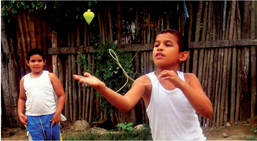
Foto: Niño jugando trompo en el corregimiento de Río Frío (Zona Bananera). Foto tomada por Jorge Giraldo, noviembre de 2009.

ese calor que no lo aguantamos. Aunque no solamente el tren tiene toda la culpa y el tren no es el de la culpa, son aquellos que mandan ese carbón y también las empresas por todo ese humo que botan, por ejemplo el humo que bota la empresa de jabón (niño de 11 años del corregimiento de Río Frío, 10 de noviembre de 2010).