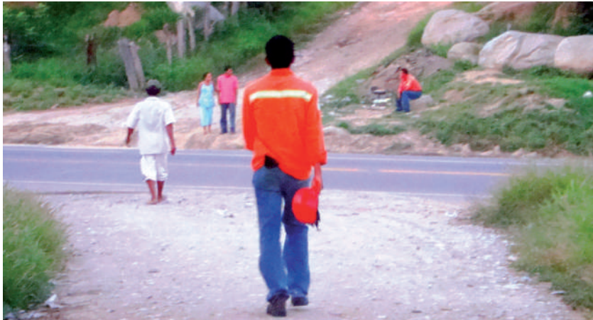
Foto: Trabajadores.