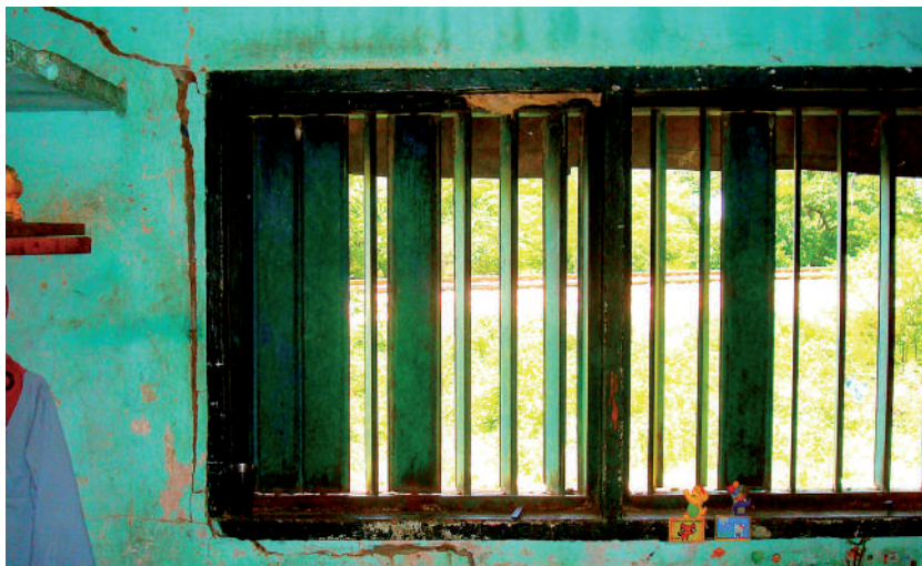
Foto: Lo que deja el carbón. vereda La Estación, municipio El Paso, 2009.