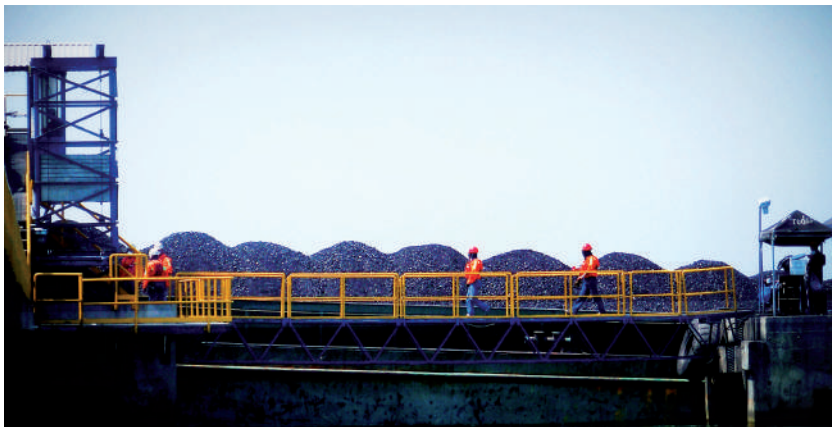
Foto: Barcaza de carbón. Foto tomada por Laura Chaves, octubre de 2009.