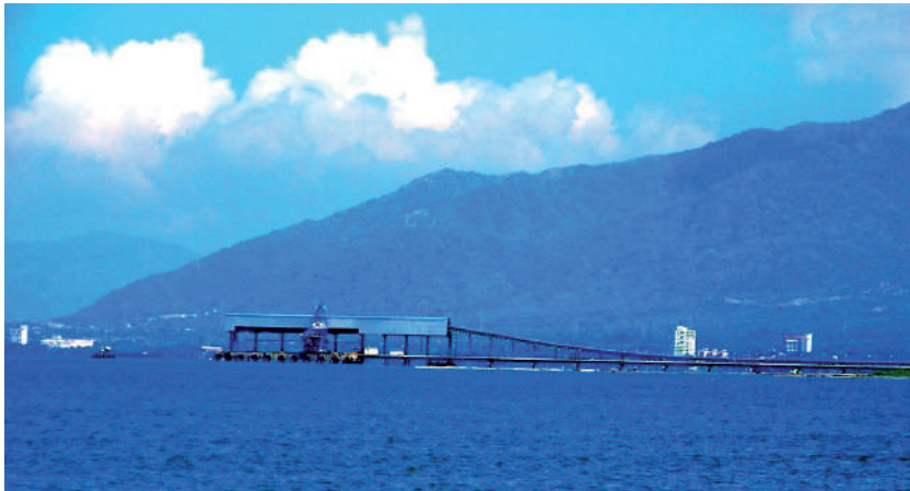
Foto: Un puerto. Ciénaga, junio de 2009