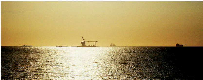
Foto: Un atardecer en Don Jaca. Foto tomada por Esperanza Ardila, octubre de 2009.