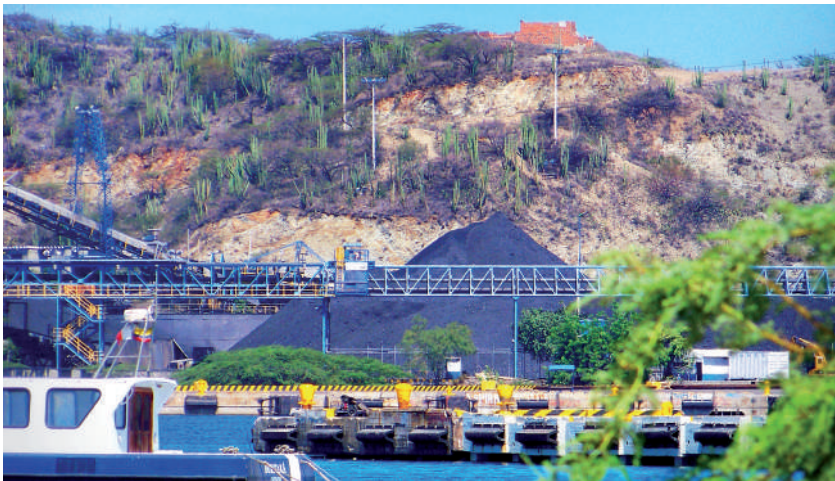
Foto: Carbón en la Sociedad Portuaria.