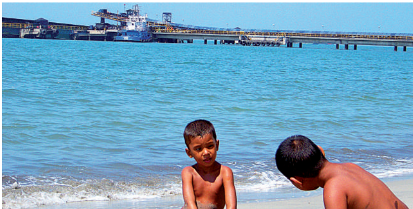
Foto: Jugando en la playa. Foto tomada por Laura Chaves, Playa de Costa Azul, octubre de 2009.