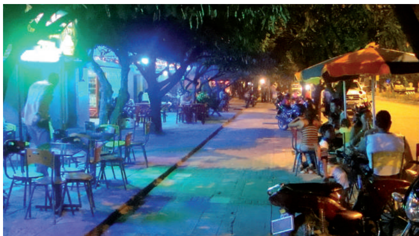
Foto: Una noche en La Jagua de Ibirico. Foto tomada por Cristian Terner, 2009.