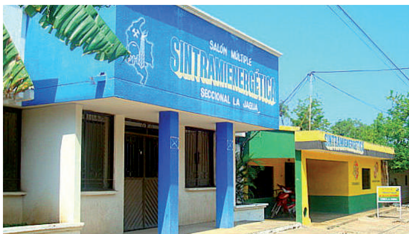
Foto: Sede Sintramienergética, seccional La Jagua de Ibirico.