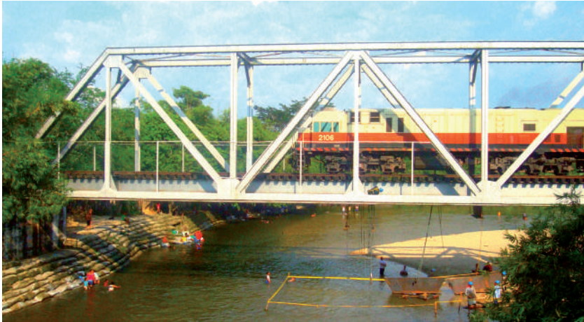
Foto: El tren pasando por el puente del río Aracataca. septiembre de 2009.