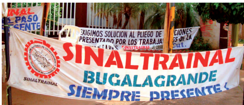
Foto: Apoyo sindical. Foto tomada por Cristian Ternera, corregimiento La Loma, 2009.

del señor Alcalde, no ha habido apoyo para las mesas de trabajo, prácticamente que para el 2010 las mesas de trabajo no cuentan con un recurso disponible para su ejecución, para su movilización, para hacer su oficio como le corresponde, ir a los ministerios de Bogotá, desplazarse hacia cualquier parte. No contamos con ningún recurso, porque el ente municipal ve en las mesas de trabajo como una persona que está en contra de la administración porque criticamos las cosas que están mal hechas. Las mesas de trabajo están conformadas en siete mesas de trabajo: está la mesa ambiental, la mesa laboral SENA, la mesa de salud, la mesa agropecuaria, la mesa de agua, la mesa social y....la mesa de salud. La gente se vincula con cartas, conformamos cada mesa 5 personas, hay profesionales en cada área, por ejemplo, en la mesa ambiental hay viveristas, hay ingenieros, ambientalistas, en la mesa de salud pues hay enfermeros, doctoras, etc., en la mesa social hay sociólogos... personas que están pendientes de lo social y así sucesivamente [...] Nosotros como representantes y líderes de las mesas de trabajo siempre hemos esta'o preocupaos por la situación de La Jagua de Ibirico y por eso es que los ministerios y el gobierno nacional siempre ha esta'o pendiente, porque es que nosotros cualquier cosa que suceda estamos formando un frente común para ver qué hacemos sobre la problemática (Eusebio García, Coordinador de la Mesa de Trabajo Ambiental de La Jagua de Ibirico, 4 de diciembre de 2009).