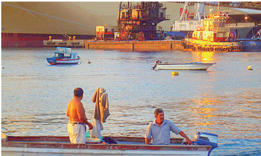
Foto: En la bahía. Santa Marta, junio de 2009

con Carbosán. Había un contrato realidad, ya formal. Y eso es lo que Carbosan no ha admitido: la contratación directa. Y eso fue lo que se pidió en un pliego de peticiones, que Carbosán tenía que contratarlos de manera directa, en la aplicación de la ley, de manera directa y aplicarles los salarios y los demás beneficios que se estaban pidiendo en el pliego de peticiones para que fueran negociados obviamente. Pero la petición principal era que los contrataran de manera directa. Ya que era una obligación que tenía Carbosán después de pasado el primer año de trabajo en misión que tenían estos trabajadores. Entonces, la reacción de esta empresa fue despedirlos desde el 20 de mayo del año pasado [2008]. Tomó la decisión Carbosan de suspender a todos estos trabajadores y no renovarles más el contrato de trabajo. Todos los 50 trabajadores, de ellos solamente 4 volvieron a reintegrarse a laborar, pero ya no con la misma bolsa de empleo sino con una cooperativa de trabajo asociado porque una de las maniobras que hizo Todo Servicio fue tratar de desaparecer como bolsa de empleo pero rencaucharse en una cooperativa de trabajo asociado y el mismo personal que antes tenía en la bolsa de empleo ahora lo metió por cooperativa de trabajo para seguir burlando las prestaciones y los beneficios de los trabajadores. Y al mismo tiempo, para evadir la responsabilidad que tiene con los trabajadores despedidos (Luis Antonio Tapias, asesor Sintramienergética, 15 de agosto de 2009, Santa Marta).