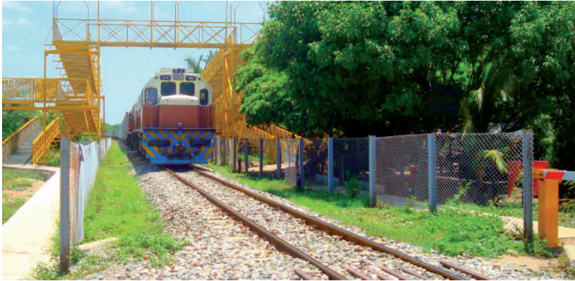
Foto: Se acerca el tren. Foto tomada por Cristian Ternera, Don Jaca, julio de 2009