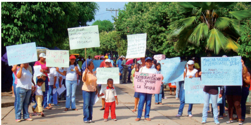
Foto: Protesta en La Jagua de Ibirico. Foto tomada por Cristian Ternerá, 2009.

la compran. [...] Bueno, lo más importante aquí, los servicios públicos es algo que la comunidad ausenta, aquí en La Loma tenemos, cuando más tenemos una hora de agua al día, todos los barrios, bueno hay unos barrios que dicen son privilegiados, pero lo normal es una hora de agua, un ratico por la mañana, un ratico por la tarde. Si nosotros con las minas, si ellos logran ponerse de acuerdo, entre ellos y los municipios, ponerse de acuerdo con la comunidad, y organizar un buen acueducto en el corregimiento de La Loma, eso sería un hit, tú sabes que donde hay agua hay vida, y nosotros aquí, el agua por pozos profundos y casi pierden el afluyente, están casi secos. Entonces yo creo que eso sería algo fundamental de ellos. Lo otro es un centro de capacitación para las personas, después que el bachiller tenga donde capacitarse con mesura, no es que van a necesitar dos operadores y van a capacitar 500, quien necesitan esos son ellos, más nadie, y tú vas a una minas de esas y oyes la producción, la producción que menos tiene está proyectada a 20 años y un municipio está proyectado a cuatro o cinco años con el alcalde de turno [...] otra cosa es que las empresas pelean con el alcalde y la que sufre es la comunidad, porque en esos cuatro años, sufre la comunidad, por estar peleaos con una sola persona (Luis Restrepo, Secretario de Minas del municipio El Paso, 15 de agosto de 2009).