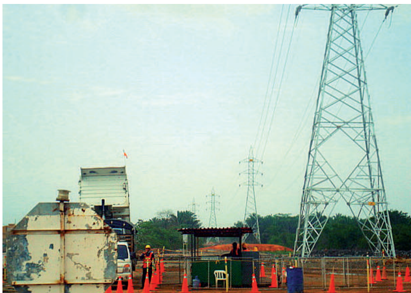
Foto: Actividad Minera. ruta que comunica la Jagua de Iberico con el corregimiento de La Loma, 2009.

No es mucho el beneficio que ha recibido el Municipio de la explotación minera, ha sido muy contrario al discurso que se le vendió al pueblo, de que la minería traería el desarrollo del Municipio y vemos que el desarrollo ha sido negativo para el pueblo porque aquí lo que se ha venido desarrollando de manera acelerada es el desastre ambiental, la prostitución infantil, la pandemia del SIDA gracias a la exportación del carbón o el transporte del carbón a través de tractomulas, son muchas las personas que han llegado a nuestro municipio contagiadas de algunas enfermedades de transmisión sexual y se han relacionado con parte de la sociedad jagüera y han venido prostituyendo a muchas adolescentes y jóvenes, y han venido acrecentando la transmisión del SIDA. También el desarrollo negativo que hemos tenido es el encarecimiento de la canasta familiar, el encarecimiento de los servicios públicos, la problemática en los servicios públicos y que a manera que va llegando población en el Municipio, traídos por el trabajo en las minas, se van dando nuevas invasiones, ocasionándose con esto un problema en la energía y el acueducto que se construyó en el Municipio hace muchos años, no da abasto abastecer toda la