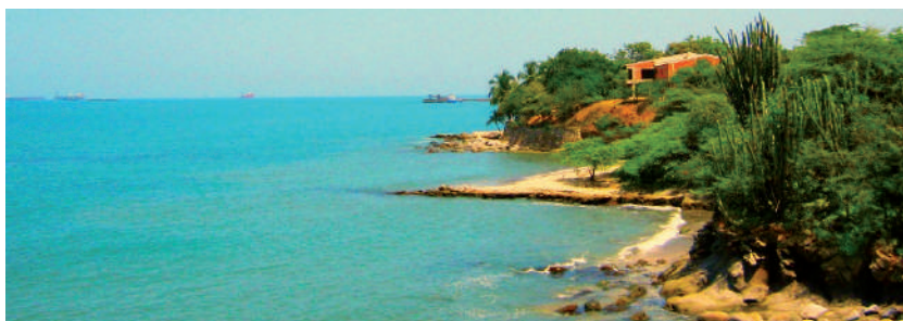
Foto: Corredor costero sur de Santa Marta.