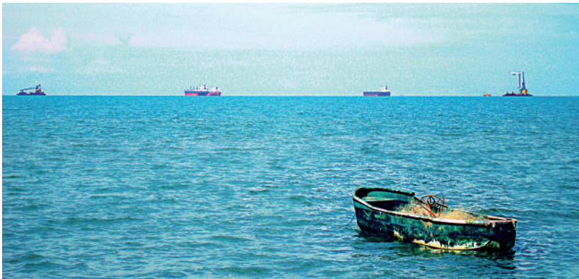
Foto: Canoa y grúas. Santa Marta, noviembre de 2009.