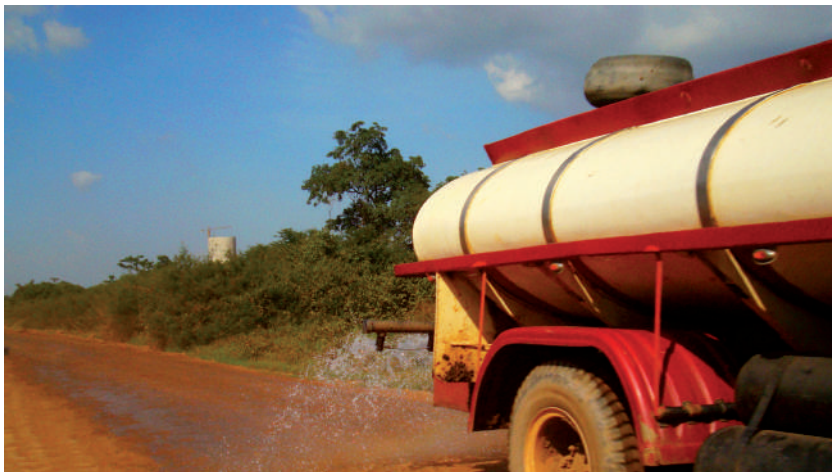
Foto: Regando la vía. ruta que comunica la Jagua de Ibirico con el corregimiento de La Loma, 2009.