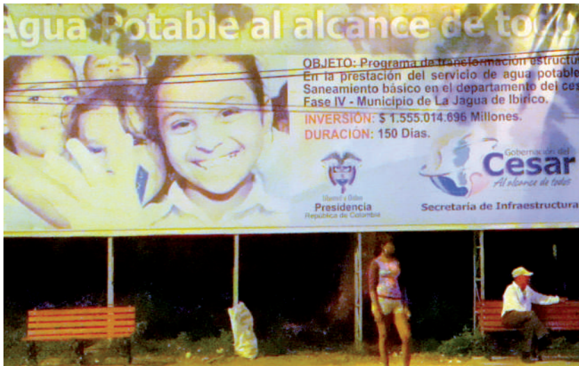
Foto: Lo que nos han prometido. Foto tomada por Cristian Ternera, La Jagua de Ibirico, 2009.

para eso le pagan al Estado su impuesto y tienen que reclamarle solución a sus problemas. Nosotros estamos reclamando independientemente que ellos le paguen los impuestos están obligados a cumplir una función social que la establece la Constitución. La Constitución señala dos cosas que en nuestro país son letra muerta. La primera es: que la propiedad privada debe cumplir una función social. Eso no está reglamentado, pero en Europa existe un gran movimiento en el sentido que las empresas buscan, en el gran movimiento que se denomina responsabilidad social corporativa. Y este año ha tomado fuerza. Ya ustedes ven la campaña de las Empresas Públicas de Medellín. Todas las empresas que están haciendo campaña publicitaria de responsabilidad social. Y la responsabilidad social corporativa es buscar cómo la empresa hace una mayor presencia económica directa, que asuman una mayor responsabilidad, no solo con los trabajadores, sino con la comunidad en la cual ellos interactúan con sus negocios. En este caso, se trataría es de reclamar una inversión social directa a las empresas multinacionales del carbón en esas comunidades que están afectando de una manera directa también sus proyectos económicos en el caso de la mina (Luis Antonio Tapias, asesor de Sintramienergética Seccional Santa Marta, 15 de agosto de 2009).