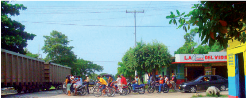
Foto: A la espera del paso del tren.