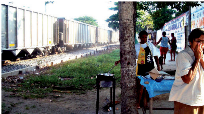
Foto: Pasando el tren por la venta de fritos. Aracataca, septiembre de 2009.