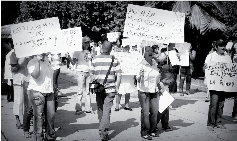
Foto: Protesta en La Jagua de Ibirico.