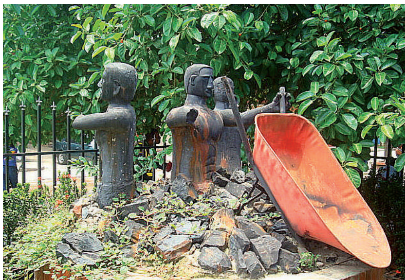
Foto: Evidencia minera, foto tomada por Cristian Ternera, La Jagua de Ibirico, 2009.