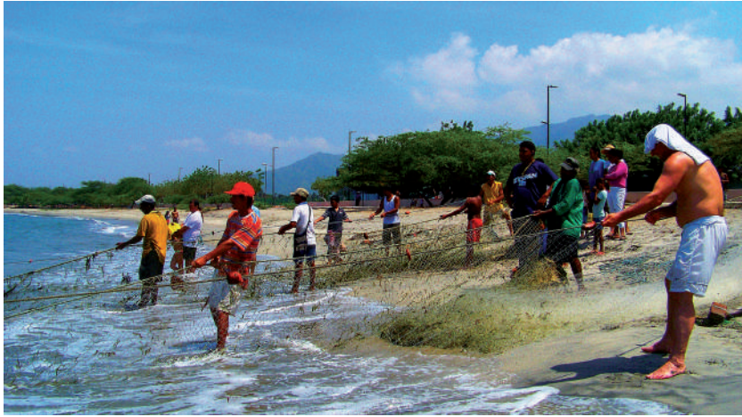
Foto: Faena de pesca. sector aeropuerto Santa Marta, octubre de 2009.