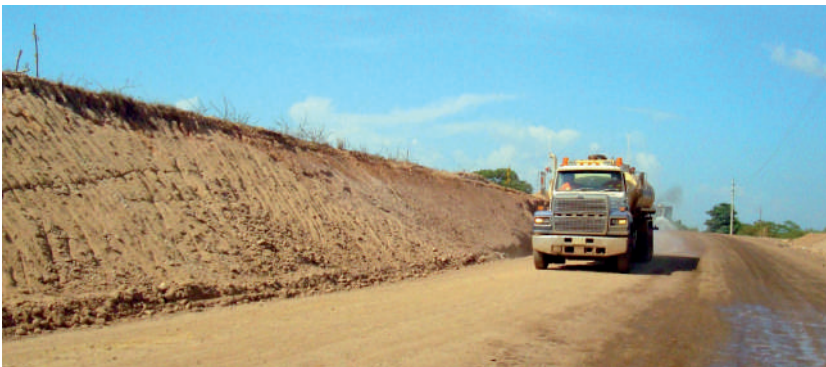
Foto: Camión sobre la vía. ruta que comunica la Jagua de Ibirico con el corregimiento de La Loma, 2009.