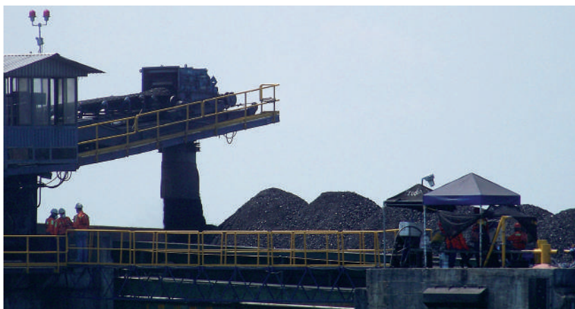
Foto: Cae el carbón.