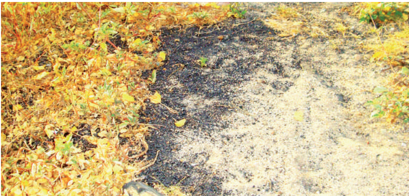
Foto: Carbón en la vía.