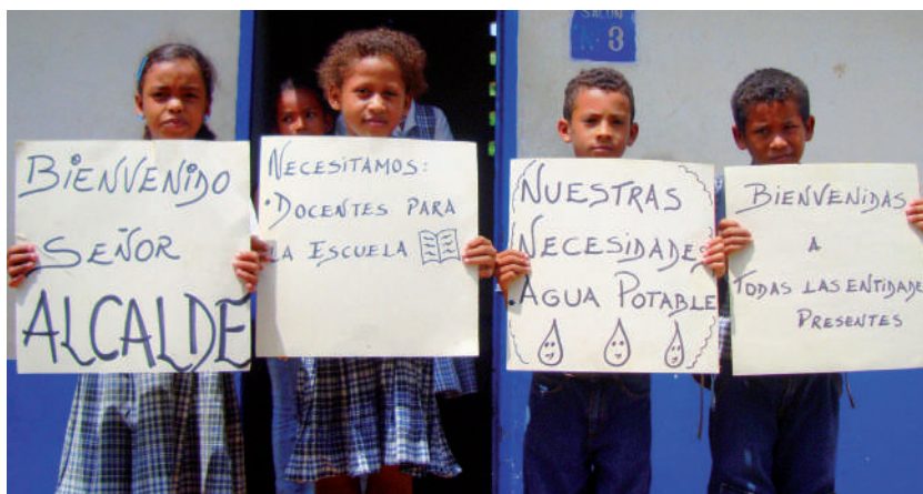
Foto: Niños y necesidades. Foto tomada por Laura Cháves, septiembre de 2009.