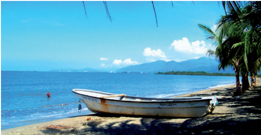
Foto: Una embarcación del Fondo Pesquero. Ciénaga, noviembre de 2009.