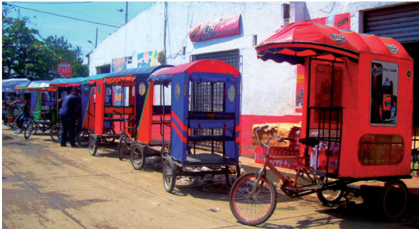
Foto: Bicitaxis. Foto tomada por Esperanza Ardila, octubre de 2009.

cogido peces que han venido llenos con puro carbón dentro. ¿Dónde cogen eso?, ah, de ahí del carbón. Una persona que logre consumir un pescado de eso, tú no sabes qué condiciones en su organismo, qué le pueda producir con el tiempo. Y eso es lo que tienen que ver las administraciones municipales y los puertos carboníferos. Hacer un estudio real, real, real de la salud del pueblo cienaguero en general, estoy hablando del pueblo cienaguero en general. Y más de los pueblos pescadores que están aledaños a estos puertos carboníferos como se encuentra Costa Verde y los que están allí alrededor, eso es lo que tiene que hacer las empresas carboníferas, pero qué falta, falta una mano más fuerte por parte de la Administración y que se pellizquen y hagan ver que los pescadores en estos momentos estamos por fuera. Mira, yo que estaba mirando una vez por televisión y vemos en Chile, la pesca artesanal allá es profesional y aquí en Ciénaga, por ejemplo, aquí en el Magdalena no se profesionaliza al pescador. El pescador debe ser un profesional de la pesca, que debe tener todas sus herramientas esenciales para irse a mar adentro. Y eso es lo que ha pasado aquí, falta además de los administradores locales apoyar a los pescadores, ¿me entiendes? (Javier Rodríguez, 15 de octubre de 2009, Ciénaga).