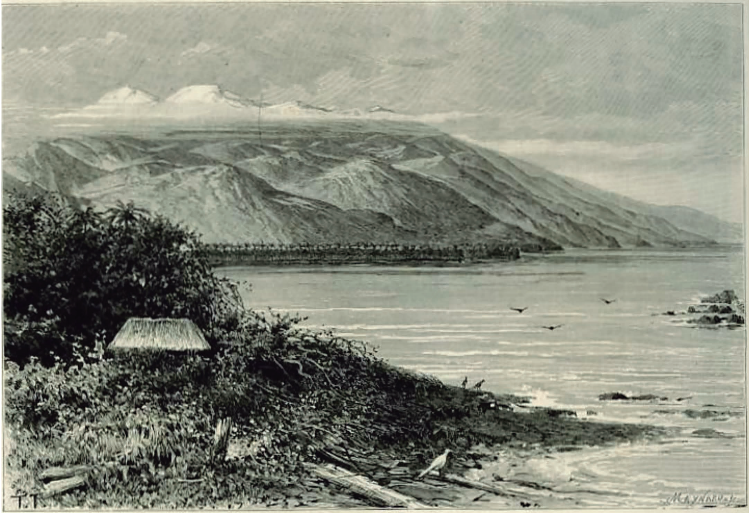
Grabado de Taylor, tomado de un apunte de Benoît Barbotin: Sierra de Santa Marta, vista al oeste de la Punta de Tapias. Elisée Réclus, Nouvelle Géographie Universelle. La Terre et les Hommes , Hachette, París, 1893.

«Tairona no es hoy otra cosa que una montaña sagrada, un Olimpo donde residen misteriosas divinidades. Allí se encuentran, al lado el uno del otro, el paraíso y el infierno, y el hombre que sea bastante temerario para aproximarse al terrible monte perecerá al instante mismo, y hará compañía a aquellos cuya morada ha profanado»